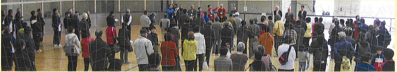
小川日立市長も臨席して『久慈サンピア日立』で2月25日、第3回多種目体験型イベントが開催されました