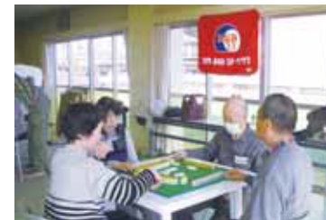
健康マージャン教室