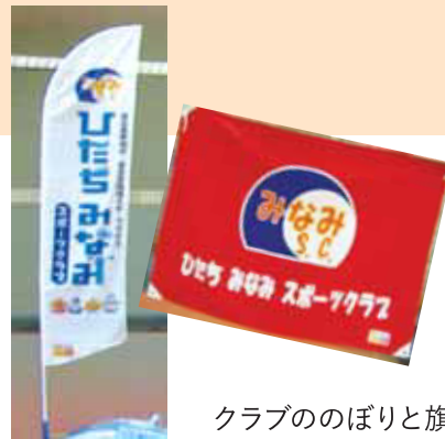
クラブののぼりと旗