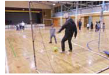
子ども複合スポーツ教室