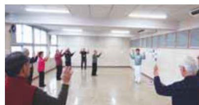
複合教室アドバイザーとの勉強会