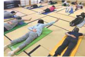
ペルビック(骨盤体操)教室