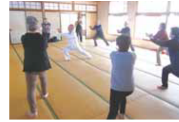
ハイブリッド呼吸法教室