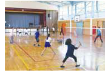
親子バドミントン教室