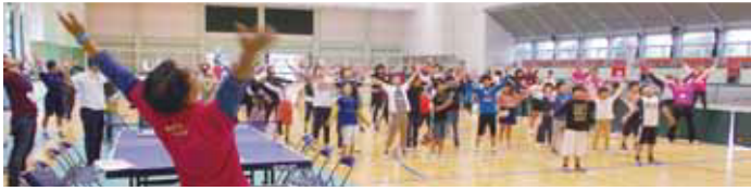
いつもより多くの子どもたちが参加しました うまく飛ぶ紙飛行機ができたかな？