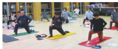
ヨガ教室 夜のヨガ教室