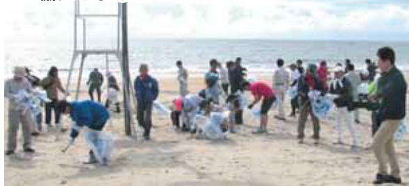
<写真下>久慈浜海水浴場の清掃活動にも協力しました

へ右写真上から、大甕神社の田をお借りして五月の田植え、九月の稲刈りまで、子どもたちは初の農業体験に大喜び。大みか祭りにもクラブの周知を兼ねて出店しました