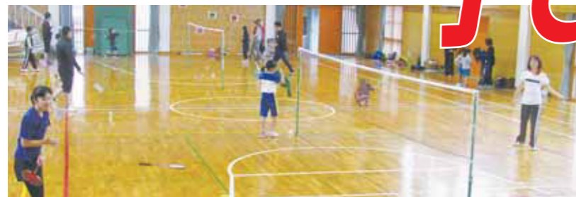
親子バドミントン教室