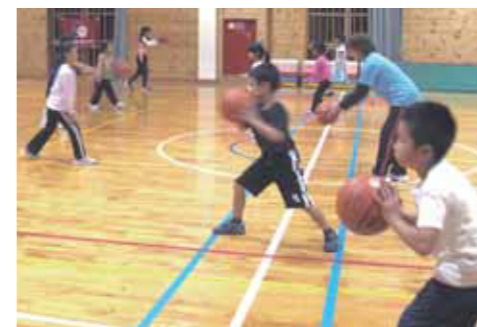
子ども複合スポーツ教室

教室の開催日、開催場所、募集人員などの詳細は当クラブホームページか電話で問い合わせください