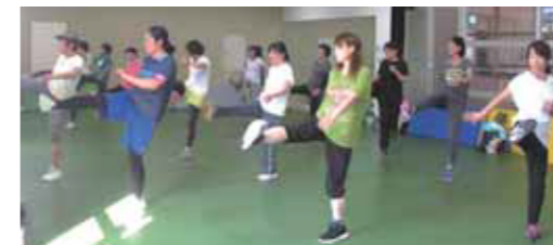
シェイプリーキック教室