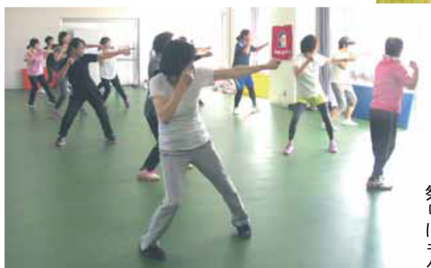
<写真上>女性は強い！ 新教室のシェイプリーキックは大盛況