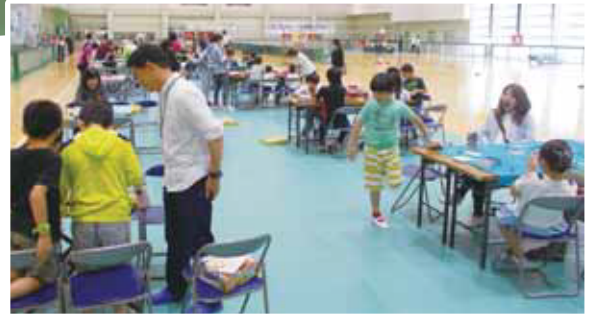
ボードゲームは種類もたくさん揃えましたが子どもたちはすぐに理解して遊び始めました