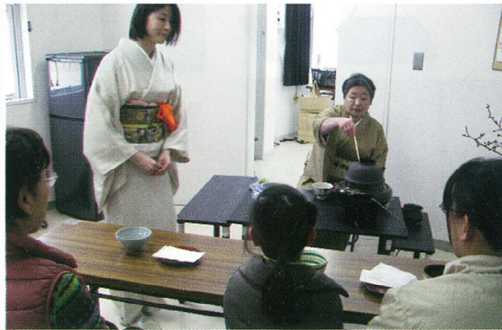
お茶やお花・フラワーアレンジメントの体験も好評でした