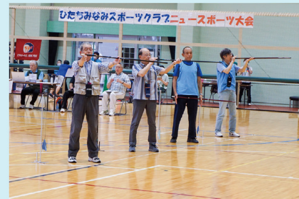
的に向かって精神を集中

また、ユニカール大会は茨城県ユニカール協会の後援をいただき、市内の他に北茨城、常陸太田、ひたちなか、常陸大宮、城里、鹿嶋から30チーム90人の参加がありました。予選リーグ戦、決勝トーナメントともに白熱した試合が続きました。