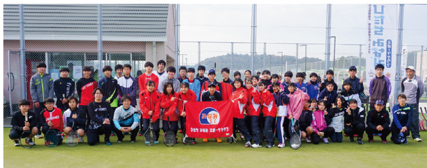
ソフトテニス参加者

現在スポーツ庁が、教職員の負担解消・少子化対応などから、中学校の部活動の地域移行を指導しています。みなみSCにもソフトテニス部の市内外中学生が多数参加。一部スポーツクラブは、学校外移行を正式に受け入れています。指導者や施設の不足、保護者負担問題など日立市が各クラブ責任者を集めて協議を進めています。令和7年度末を目途に休日の部活動を完全移行する予定です。