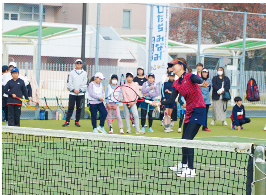
講習会風景 硬式テニス

新たな展開として、会員などに各競技の神髄の片鱗を目の前にと春はソフトテニス、秋にも国内トッププロ選手とコーチに直接、ソフトテニス・バドミントン・硬式テニスの手本とアドバイスの実技指導の講習会を実施しました。夏休みには茨城キリスト教大学の学生と子ども複合スポーツ教室会員の小学生との懇親や宿題指導、夕食会まで試みました。