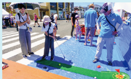
ローリングゴルフで景品ゲット

大みかコミュニティを中心とした大みか祭り実行委員会の好意により、みなみSCのPR活動をしました。「第10回大みか祭り」は昨年8月26日(土)4年ぶりの開催。ブースには、輪投げとローリングゴルフのゲームコーナーを設け、子どもたちに楽しんでもらいました。