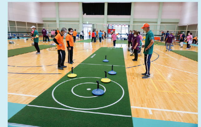
ユニカールはチームワークと作戦